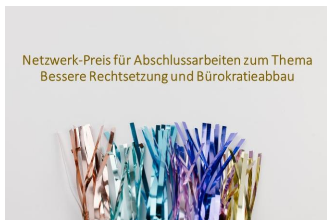
Netzwerk-Preis für Abschlussarbeiten zum Thema Bessere Rechtsetzung und Bürokratieabbau

Im Rahmen der diesjährigen Jahreskonferenz 2024 wird zum vierten Mal der Netzwerk-Preis für Abschlussarbeiten zum Thema Bessere Rechtsetzung und Bürokratieabbau verliehen.